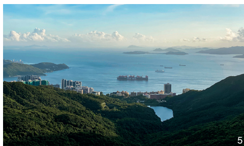
5 保护城市里的大尺度自然要素：人们可以获得崇高的情感体验 Preserving the large scale natural features in the city: citizens can have multiple experiences of sublime landscape